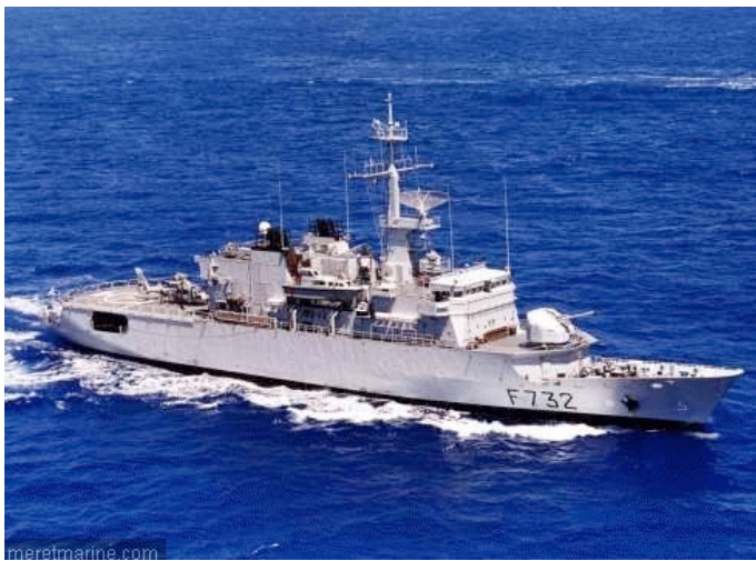
Frégate "Nivôse" équipée d'un hélicoptère Panther (Eurocopter)

La sécurité commence par la confidentialité des communications entre les forces de sécurité. EADS a conçu des solutions technologiques spécifiques permettant de protéger les systèmes de commandement et de contrôle de ses clients contre les intrusions. EADS a notamment acquis un savoir-faire inégalé dans la conception, l'intégration et le déploiement de systèmes radio sécurisés, de transmission sécurisée à haut débit et de messageries universelles.