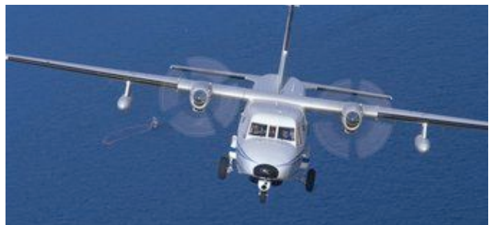
Casa de patrouille maritime